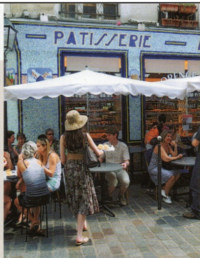
Une boulangerie de quartier, Paris, 2015.

■ D'après Jean Ollivro, « La mondialité », « La distance objet géographique », Atala , 2009.