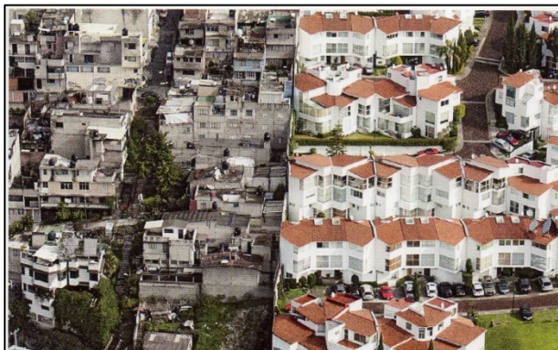
La séparation entre riches et pauvres à Mexico (Mexique), 2015.

1 Quartiers respectueux des enjeux écologiques, du bien vivre ensemble.