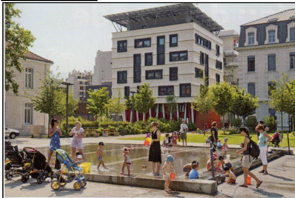
Un éco-quartier à Grenoble, France, 2013.